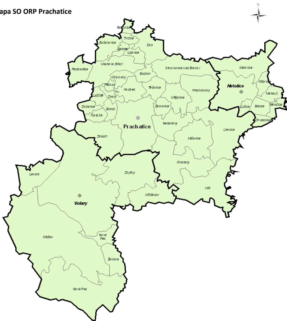
Mapa SO ORP Prachatic